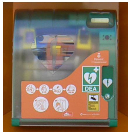
Detall de la cabina

Totes les cabines estan connectades a un centre de control web 365 dies, 24 hores al dia . La cabina realitza periòdicament controls automàtics de funcionament.