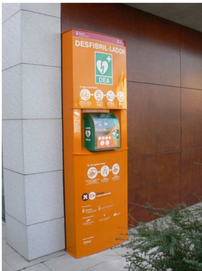
Exemple de CRC